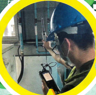
設備機房溫度檢測