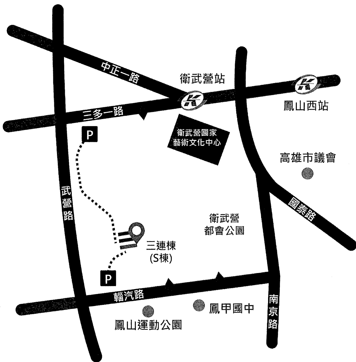
衛武營都會公園三連棟(S棟)位置示意圖